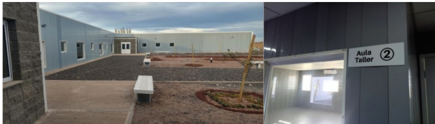
1 Centro de Formación Profesional Añelo